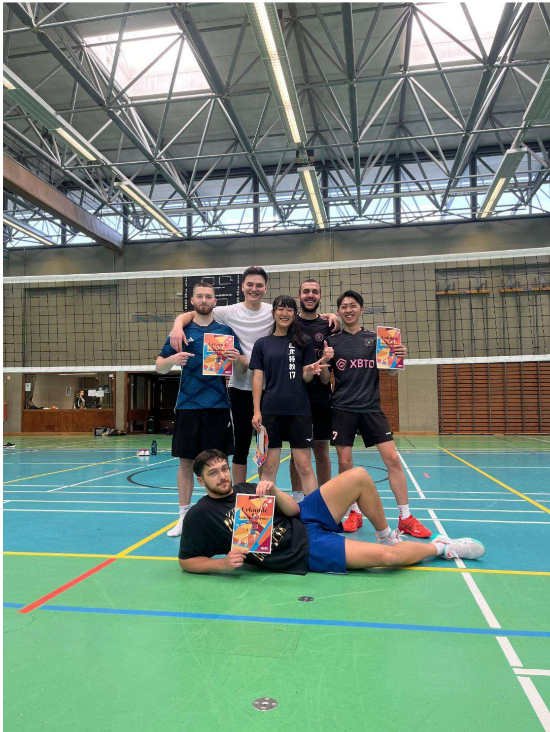
跟隊友一起拿下冠軍