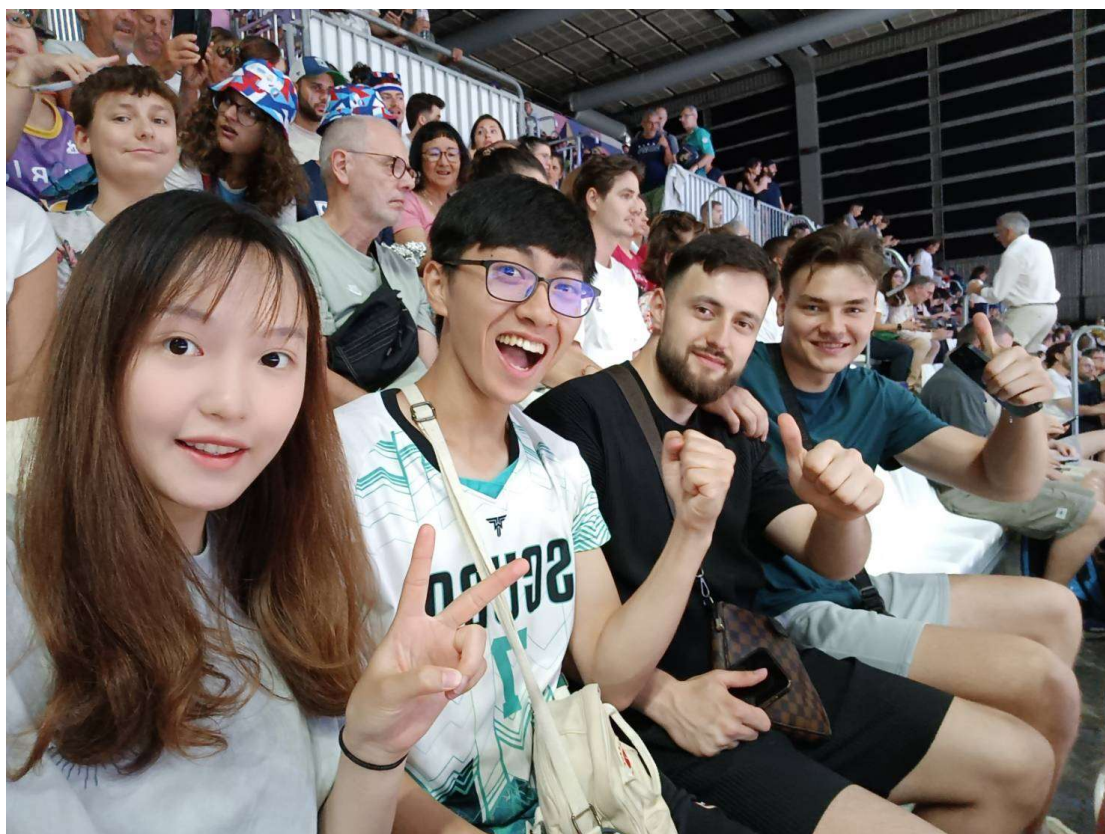
跟隊友一起去巴黎看奧運