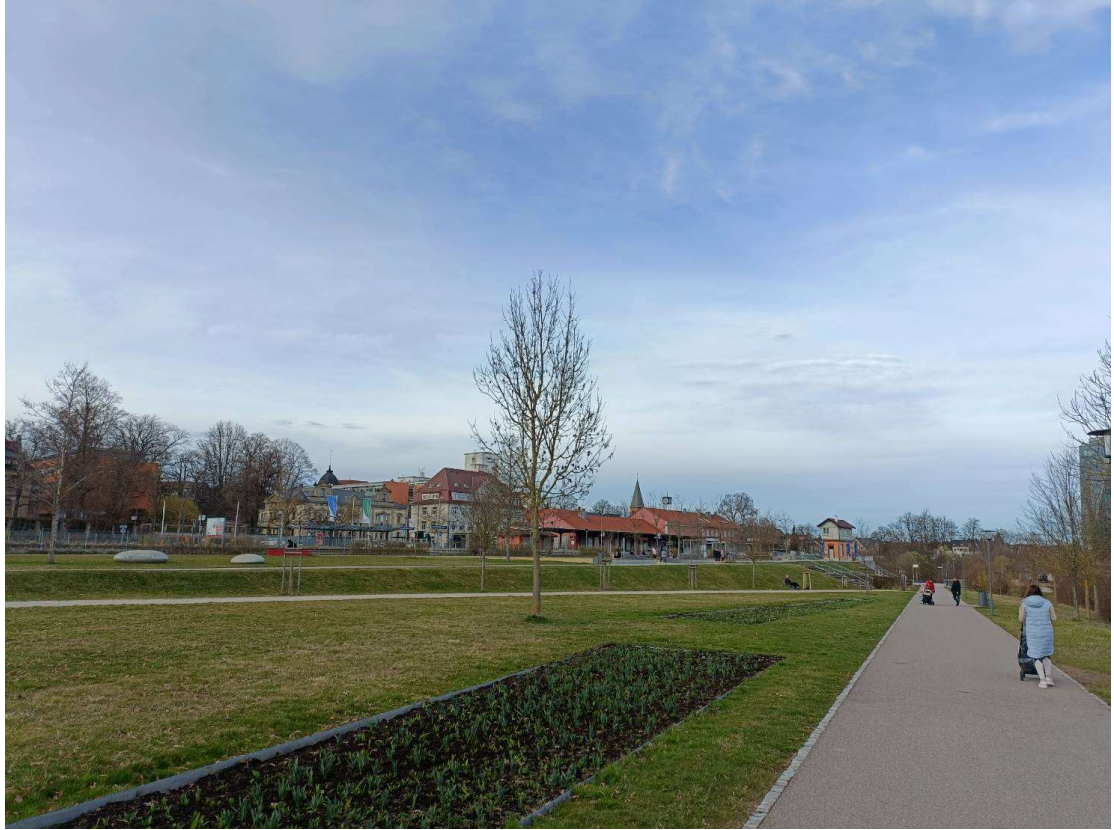
施文寧根的漂亮公園