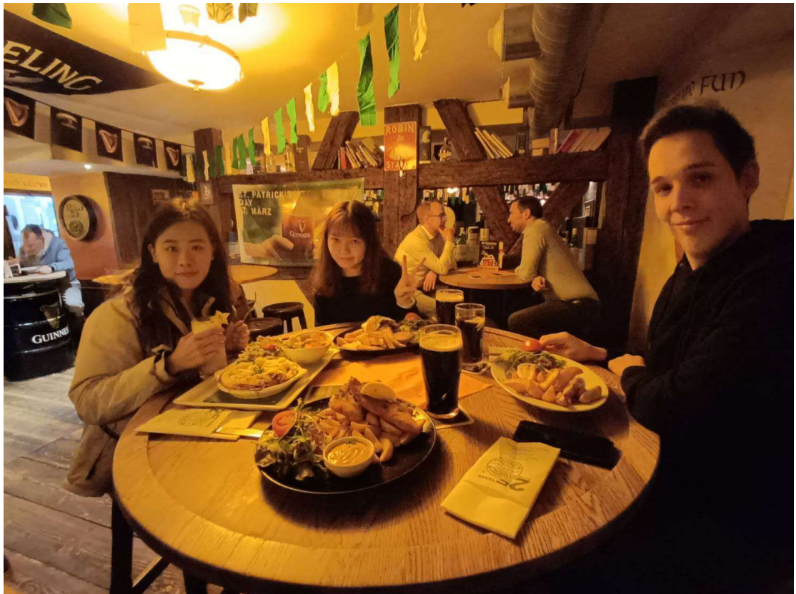
跟朋友吃的第一餐