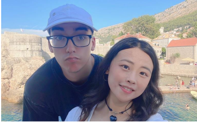
在克羅埃西亞認識的美國人，一起逛老城，他當我的免費導遊+英文老師