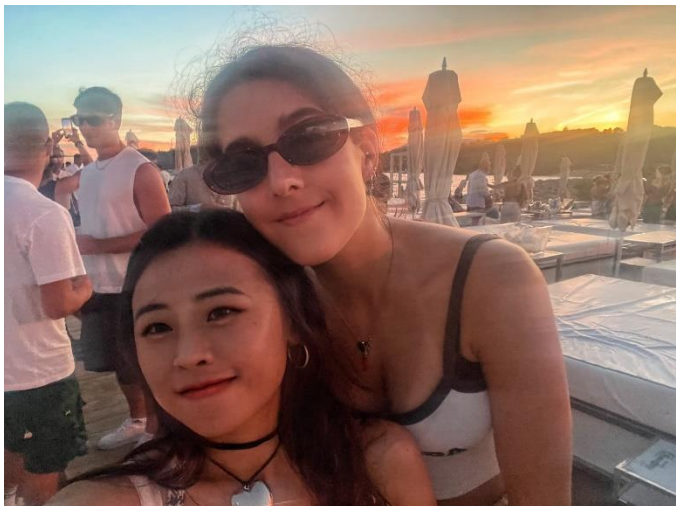
在西班牙的 Ibiza 海島，認識義大利女生，一起參加很多活動