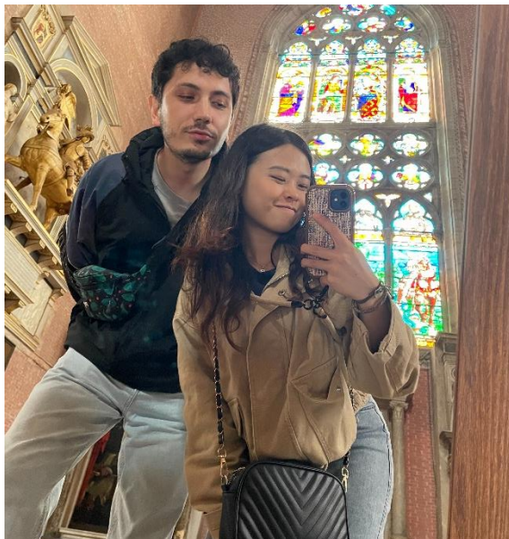
我最愛的土耳其室友，每次旅行完，我們都會交流彼此的經歷，很有趣。